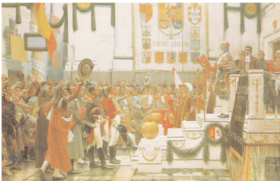
Cortes de Cádiz, 1812

rechazo social o el deterioro de su carrera profesional.