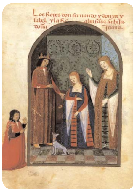
Los Reyes Católicos y la infanta doña Juana, 1482 Os Reies Católicos e a infanta dona Xoana, 1482

El Reino de Castilla era el reino con más titulados: 35 linajes con 78 títulos: 15 Duques, 13 Marqueses, 45 Condes, y 3 Vizcondes (1). El Reino de Aragón tenía 28 linajes con 42 títulos: 12 Duques, 1 Marqués, 5 Condes, 6 Vizcondes y 18 Barones. El Reino de Navarra tenía 12 linajes con 15 títulos: 1 Marqués, 3 Condes, 6 Vizcondes, y 5 Barones.